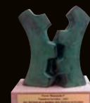
Premio "Economía 3" - 2007 Mejor Trayectoria Formativa

Más información en: INSTITUTO DE ESTUDIOS DE LA EMPRESA Universidad Católica de Valencia "San Vicente Mártir"